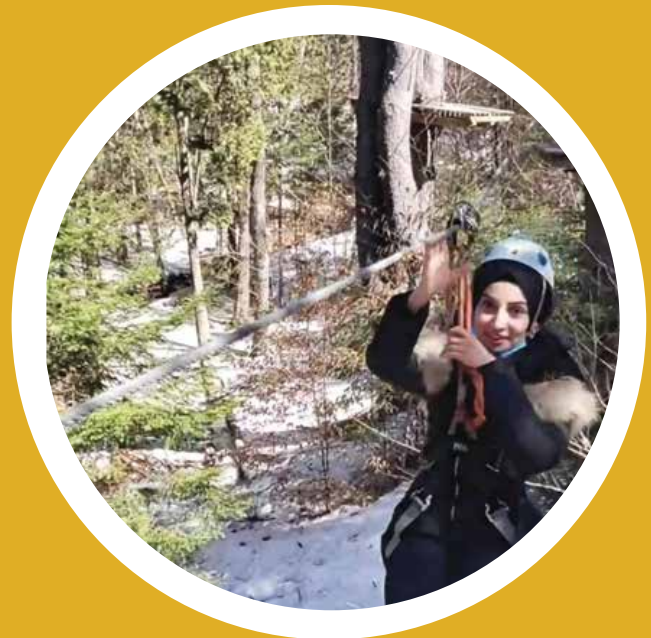
Sortie printemps 2021 - Arbraska