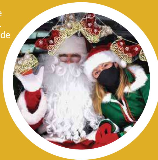
Virée de Noël – 22 décembre 2020