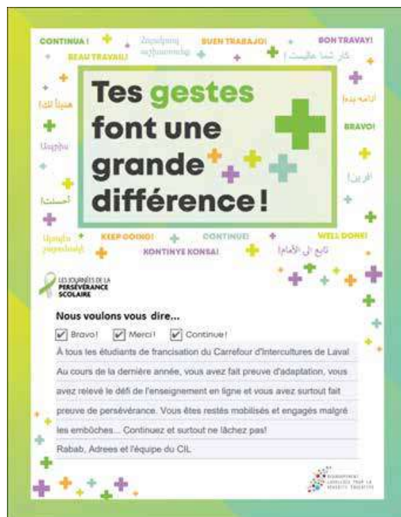
Message d'encouragement aux étudiants de francisation dans le cadre de la semaine de la persévérance scolaire