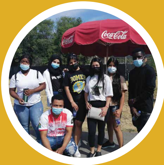
Les jeunes du comité de Laval - projet ORION Sortie La Ronde - Été 2021