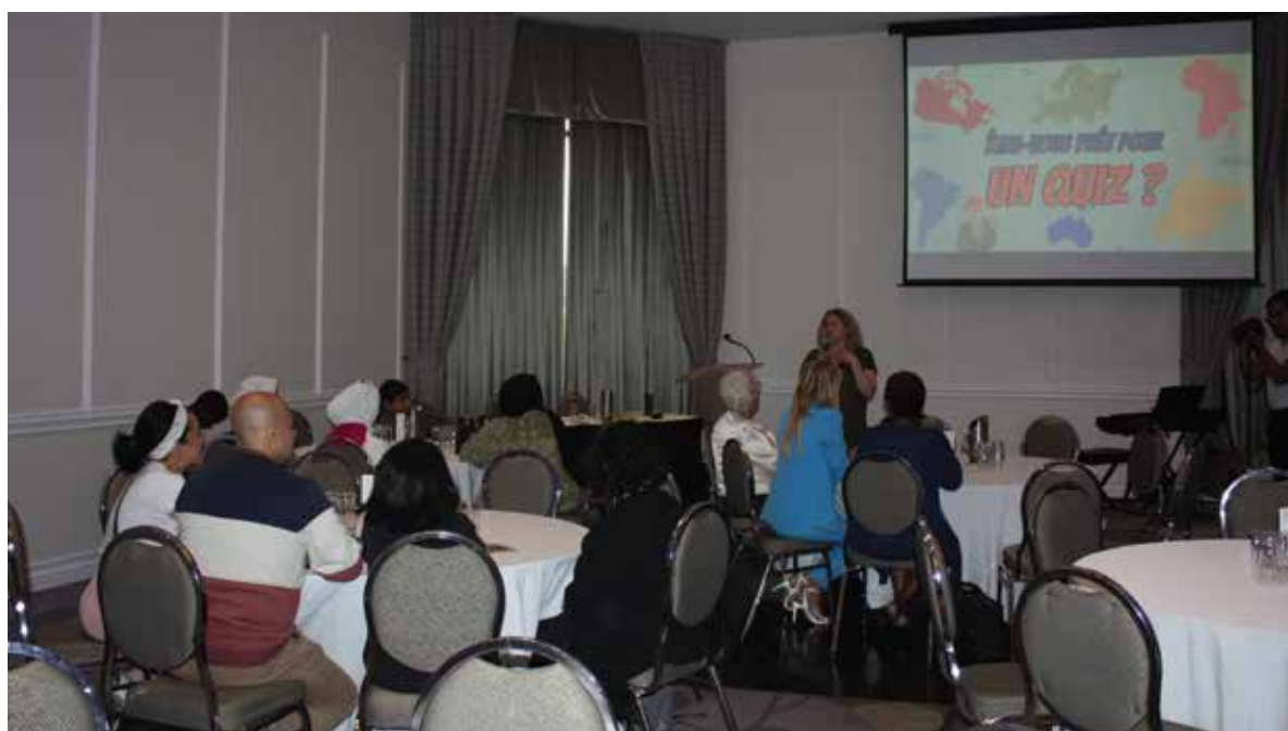
Activité pour souligner la journée mondiale de réfugiés, 20 juin 2023

22 séances d'information (plus de 38 heures d'activité ; 292 participants : 54% de femmes et 42% d'hommes, 18% des séances d'information étaient destinées aux demandeurs d'asile afin de leur présenter les services gouvernementaux disponibles. Ces séances ont été offertes en français, en anglais et en espagnol.